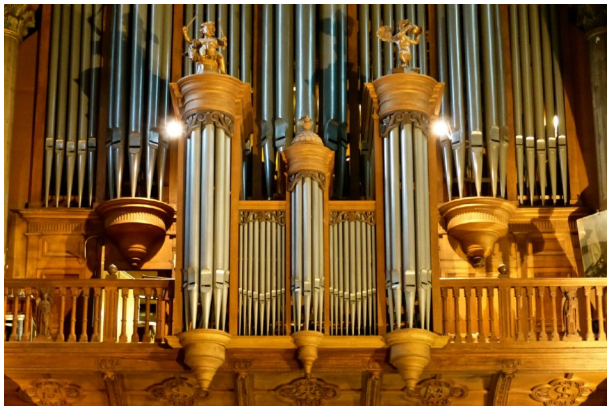
Orgue de St Germain-des-Prés.